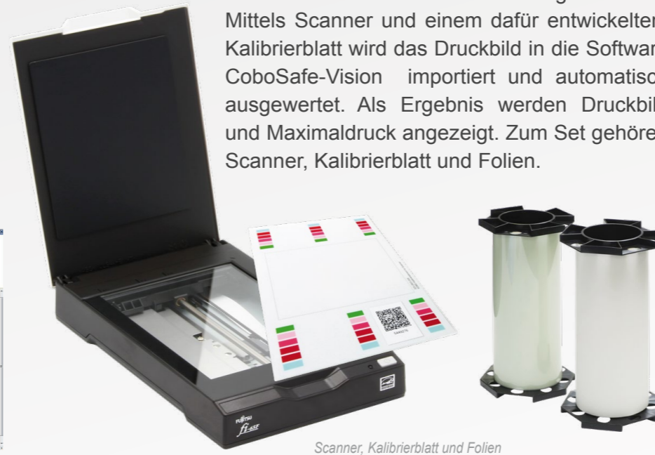
Scanner, Kalibrierblatt und Folien

Die Folien reagieren auf den Druck und zeigen die Druckverteilung an. Die Druckkraft wird durch die Intensität der Verfärbung bestimmt. Mittels Scanner und einem dafür entwickeltem Kalibrierblatt wird das Druckbild in die Software CoboSafe-Vision importiert und automatisch ausgewertet. Als Ergebnis werden Druckbild und Maximaldruck angezeigt. Zum Set gehören Scanner, Kalibrierblatt und Folien.